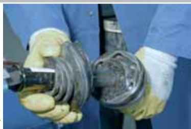
Оттяните пыльник назад.

ВНИМАНИЕ! Не работайте без спецодежды. Падающий инструмент или запчасть могут причинить тяжёлую травму.