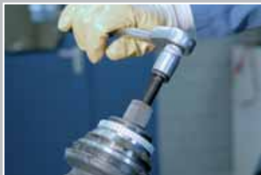
Снимите шарнир с профильного вала.

Профильные валы без резьбы: с помощью пластикового или резинового молотка снять шарнир с профильного вала.