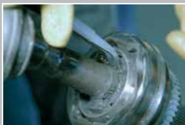
Разожмите стопорное кольцо.

На шарнирах с внутренним (скрытым) стопорным кольцом, постукивая пластиковым или резиновым молотком по торцевой части шарнира, снять шарнир с профильного вала.