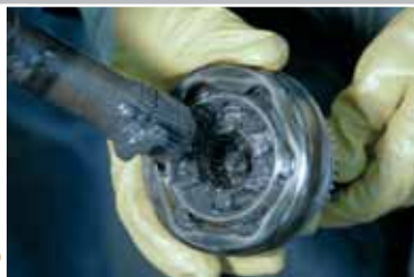
Стяните гофрированный чехол. Очистите шарнир от старой смазки.