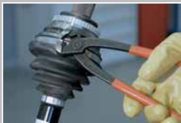
Ослабьте оба хомута.

ВНИМАНИЕ! Не работайте без спецодежды. Падающий инструмент или запчасть могут причинить тяжёлую травму.